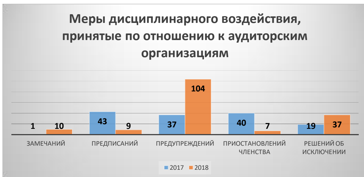
Диаграмма 8. Меры дисциплинарного воздействия по аудиторским организациям-членам СРО РСА в 2017-2018 гг.

другим применялись меры дисциплинарного воздействия в виде предупреждения, денежных штрафов.