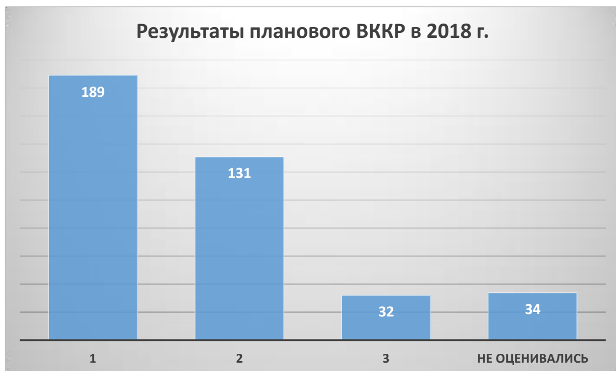
Диаграмма 2. Результаты ВККР аудиторских организаций и индивидуальных аудиторов в 2018 году.

В 2018 г. количество проверок, закончившихся выявлением существенных нарушений, и как следствие, невыдачей Свидетельства о прохождении ВККР, значительно уменьшилось в относительном выражении, несмотря на то, что в 2018 году Комитет по контролю качества предложил Правлению СРО РСА, а Правление утвердило, применять при рассмотрении результатов плановых проверок качества работы критерия систематичного характера нарушений. Всего по результатам ВККР в 2018 г. было выдано 223 Свидетельства, из них 34 с информацией, что качество аудиторской деятельности не оценивалось в связи с неосуществлением такой деятельности (см. Диаграмма 2).