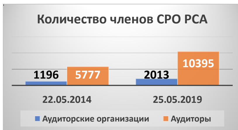
Диаграмма 1. Рост численности членов СРО РСА