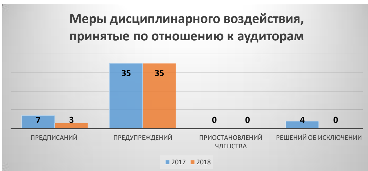
Диаграмма 8. Меры дисциплинарного воздействия по аудиторам-членам СРО РСА в 2017-2018 гг.

Характер дисциплинарных дел постепенно меняется. В отчетном периоде в основном рассматривались итоги ВККР членов СРО, случаи уклонения от проверок, а также вопросы этического характера. Безусловно, рассмотрение таких материалов требует не только жизненного и профессионального опыта, но и досконального знания действующего законодательства.