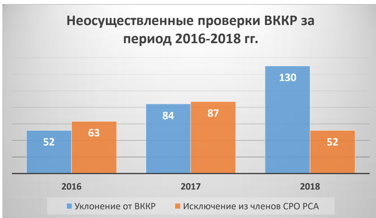
Диаграмма 4. Количество неосуществленных плановых проверок в 2016-2018 гг.

Кроме плановых ВКР в 2018 г. было проведено 88 внеплановых проверок, что на 54 проверки больше, чем в 2017 г. В основном внеплановые проверки осуществлялись по жалобам, однако, внеплановый ВКР в отчетный год ознаменовался активной деятельностью СРО РСА по проведению проверок в рамках соблюдения требований противоотмывочного законодательства, которые проводились как внеплановые по решению Правления СРО РСА. (Диаграмма 5).