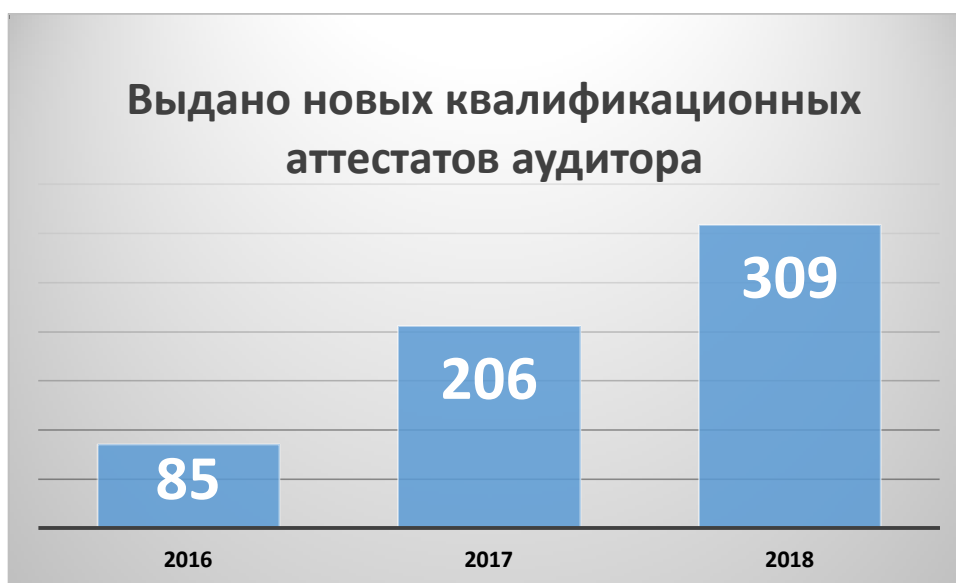
Диаграмма 7. Сведения о количестве новых квалификационных аттестатов аудитора, выданных СРО РСА в 2016-2018 гг.

квалификационных аттестатов, а в 2016 году выдано 85 единых квалификационных аттестатов.