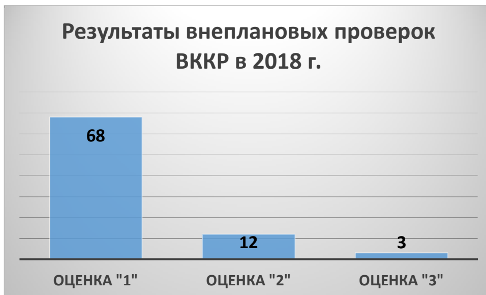
Диаграмма 6. Результаты внеплановых проверок, осуществленных в 2018 г.

Диаграмме 5. Как видно из диаграммы количество внеплановых проверок, закончившихся без выявления существенных и грубых нарушений (оценка «1») превышает количество ВККР с выявленными нарушениями (оценка «2» и оценка «3»). Данный факт наглядно показывает, что не все жалобы, поступающие в СРО РСА, являются необоснованными.