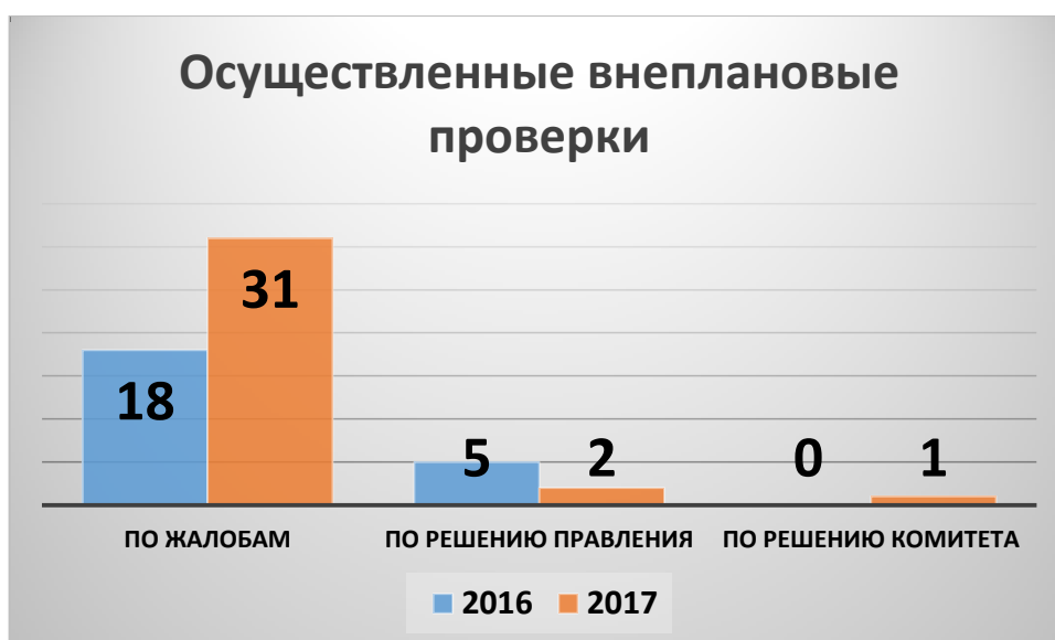
Диаграмма 4. Количество внеплановых проверок, осуществленных в 2016-2017 гг.

По результатам внеплановых проверок выставлялись такие же оценки, как и по итогам планового ВККР. Информация об оценках внеплановых проверок приведена на Диаграмме 5. Как видно из диаграммы количество проверок, закончившихся выявлением существенных нарушений, составляет ровно 50%. Данный факт наглядно показывает, что далеко не все жалобы, поступающие в СРО РСА, являются необоснованными.