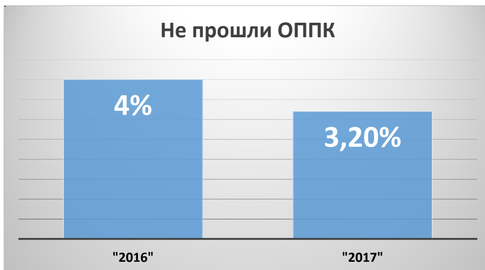
Диаграмма 6. Количество аудиторов (в %), не прошедших обучение по программам повышения квалификации в 2016-2017

В 2017 году повысили свою квалификацию 9747 аудиторов-членов СРО РСА (в 2016 году – 5359), не прошли повышение квалификации 324 аудитора (в 2016 году – 227). К сожалению, аудиторы уходят из профессии.