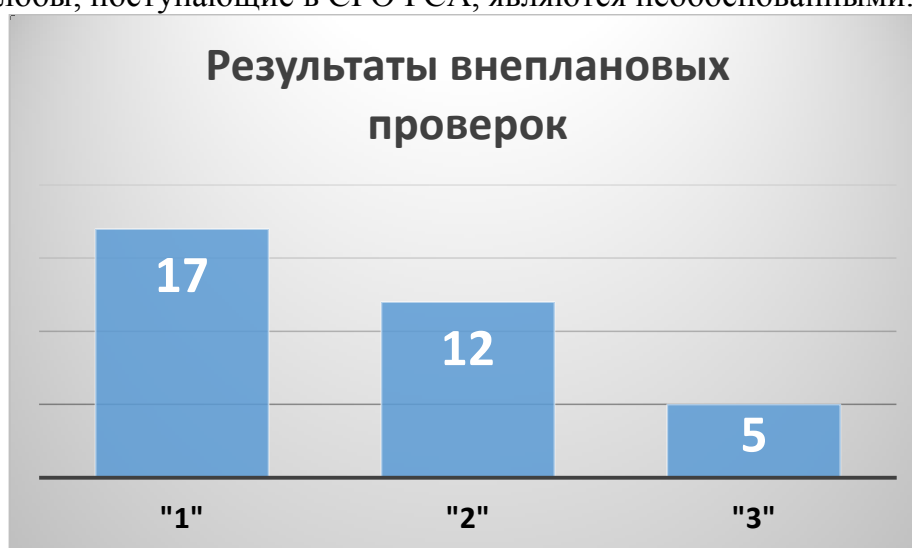
Диаграмма 5. Результаты внеплановых проверок, осуществленных в 2017 г.

По результатам внеплановых проверок выставлялись такие же оценки, как и по итогам планового ВККР. Информация об оценках внеплановых проверок приведена на Диаграмме 5. Как видно из диаграммы количество проверок, закончившихся выявлением существенных нарушений, составляет ровно 50%. Данный факт наглядно показывает, что далеко не все жалобы, поступающие в СРО РСА, являются необоснованными.