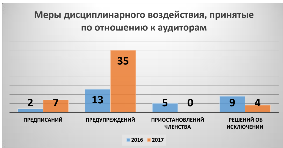
Диаграмма 8. Меры дисциплинарного воздействия по аудиторам-членам СРО РСА в 2016-2017 гг.

Принято 140 мер дисциплинарного воздействия по аудиторским организациям (см. Диаграмму 9):