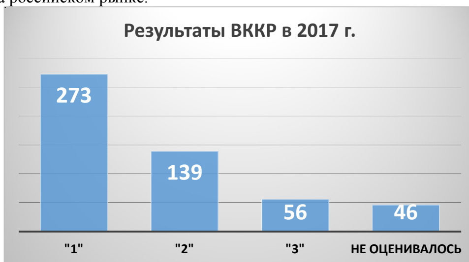
Диаграмма 1. Результаты ВККР аудиторских организаций и индивидуальных аудиторов в 2017 году.

действие Классификатора, но и усилением требований к качеству аудиторской деятельности на российском рынке.