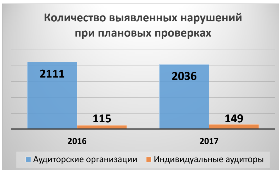
Диаграмма 2. Количество нарушений, выявленных в 2016-2017 гг.

Если говорить о самих нарушениях, выявляемых в 2017 г. при ВККР, то их количество также значительно увеличилось, на Диаграмме 2 представлено число нарушений, выявленных у аудиторских организаций и индивидуальных аудиторов.