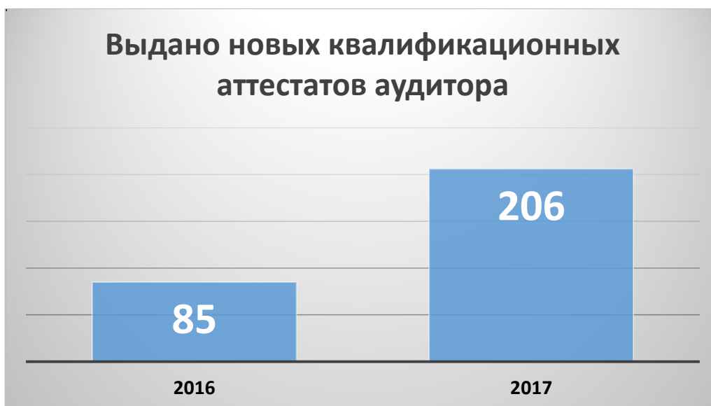
Диаграмма 7. Сведения о количестве новых квалификационных аттестатов аудитора, выданных СРО РСА в 2016-2017гг.