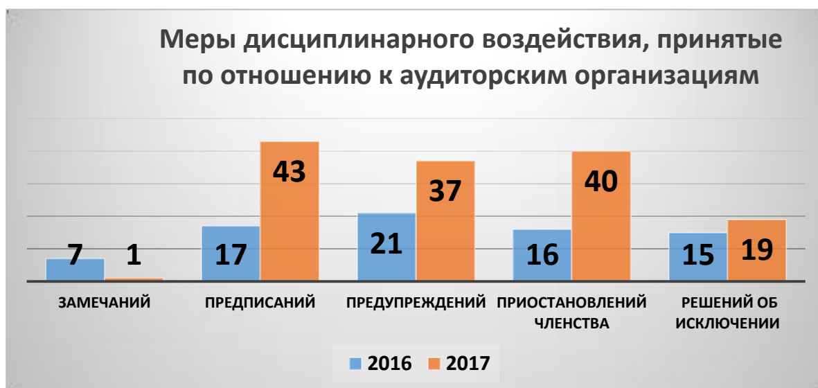
Диаграмма 9. Меры дисциплинарного воздействия по аудиторским организациям-членам СРО РСА в 2016-2017 гг.

Департамент внутреннего контроля и дисциплинарного производства СРО РСА постоянно осуществлял контроль за исполнением решений Совета по аудиторской деятельности по совершенствованию деятельности саморегулируемой организации аудиторов в части применения мер дисциплинарного воздействия.